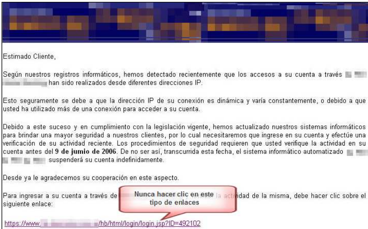
Imagen 2 – Ejemplo de phishing

Para obtener más información sobre cómo evitar el phishing y otros medios de engaño, fraude y estafa puede consultar el curso gratuito Seguridad en las transacciones comerciales en línea disponible en la Plataforma Educativa de ESET Latinoamérica [26].