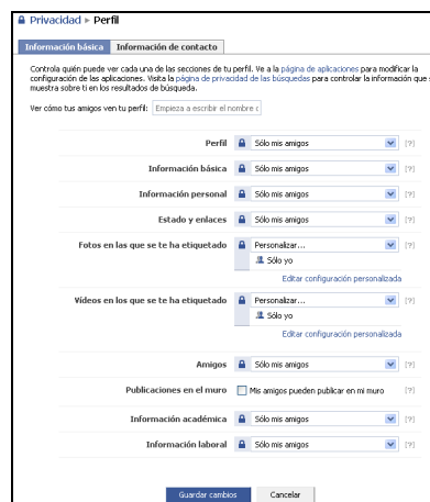
Imagen 3 – Configuración de privacidad en Facebook